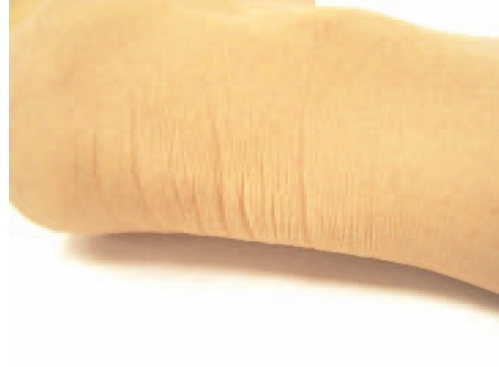
Orteils et peau